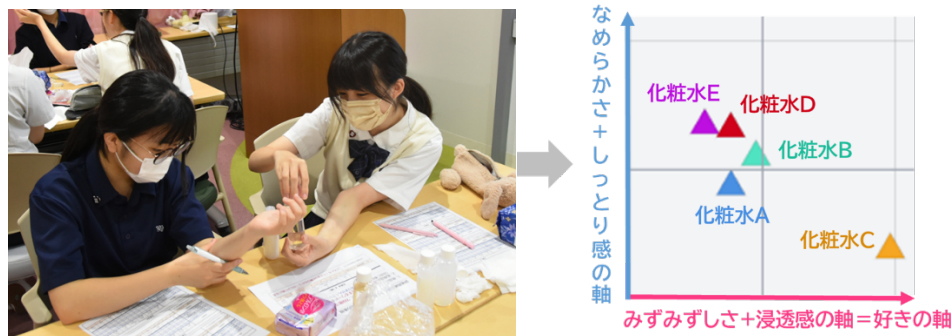
図2 Yamawaki 感性マップの作成

主成分分析 (PCA) ：商品についてのアンケート結果から、評価項目を要約し、「Yamawaki 感性マップ」を作成して商品の立ち位置を可視化した。